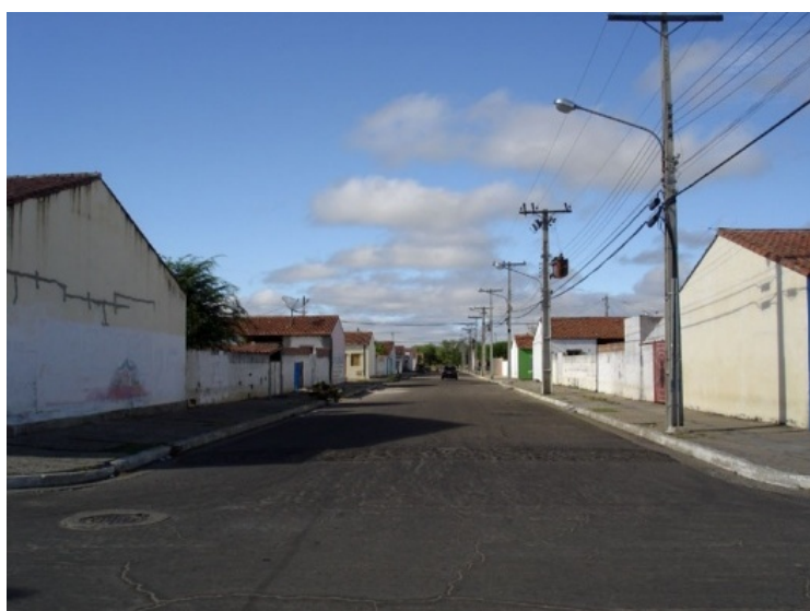
Ruas N-S praticamente sem modificações